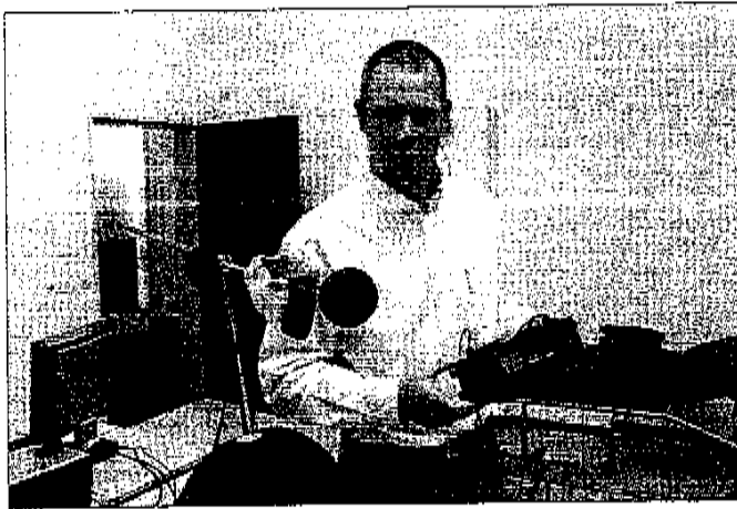
„Bezoekers kunnen onze apparatuur bekijken en er vragen over stellen.”

„Dat er meer mensen met een gehoorprobleem bijkomen komt niet alleen door een lawaaige omgeving. Ook door de vergrijzing gaat een groot deel van de bevolking slechter horen. „Als je ouder wordt, gaat je gehoor achteruit, dat is een gegeven. Maar wat je ook ziet, is dat veel jongeren in een geluidsrijke omgeving vertoeven met de walkman of de MP3-speler op het hoofd. De lange termijn effecten daarvan zijn nog onvoldoende bekend. We hebben wel een indicatie. Het lijkt tot een beginschade die bij het ouder worden sneller problemen gaat opleveren. Vroeg of laat komt die gehoorbeschadiging als je geen preventieve maatregelen neemt. Een lichtpuntje is dat de ARBO wetgeving, bij beroepen waar men met veel lawaai te maken heeft, de laatste tijd beter geregeld is,” aldus Taalman. Meer informatie: www.acamersfoort.nl .